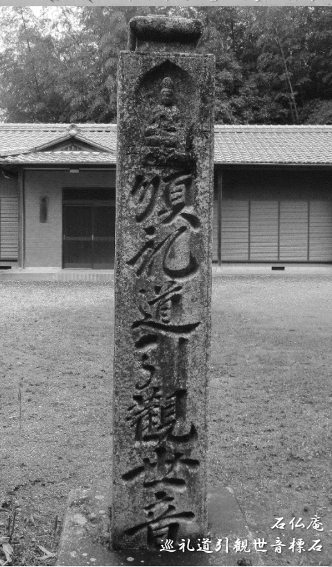
石仏庵 巡礼道引観世音標石