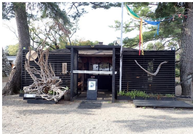
県産材の格子で囲まれた施設外観