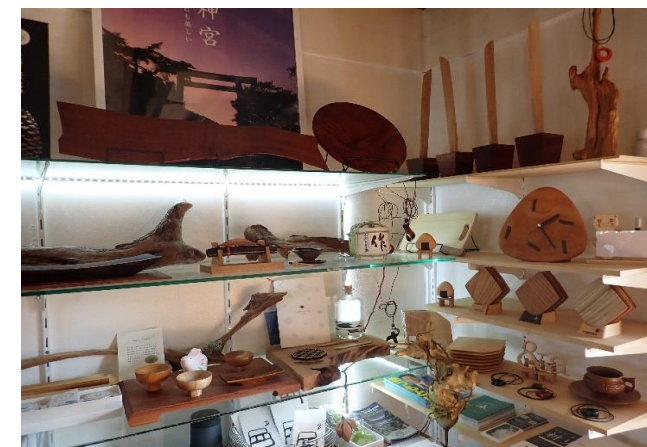
県産材木製品を中心とした アートギャラリー