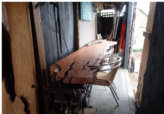
県産材を使用したカウンター