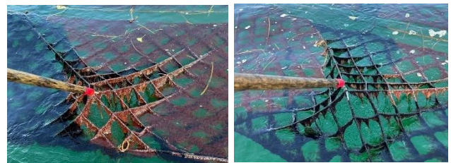
図 10. ギョニゲールを設置したセット (左) と設置していないセット (右) のノリ葉体