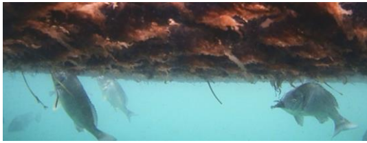
図 5. ノリを摂食するクロダイ