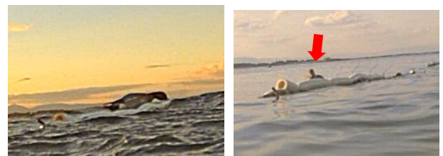
図 11. カバーを乗り越えられず侵入に失敗する様子 (左) と回避行動をとる様子 (右、矢印がカモ類)

画像解析できた7日間、毎日カモ類が出現したが、カバーを乗り越えてセット内に侵入したのは1回のみで、カバーのない箇所への回避行動がみられた(図11)。カバーは弾力性があり、設置したまま活性処理も可能である。浮き流し漁場におけるカモ類による食害対策としては、ノリ網に重りをつけて70cm程度沈下させる方法が知られているが、ノリ葉体が弱くなったり、珪藻がつきやすくなったりするため、今一色地区では導入されていない。今回、カバーを4m設置したのみであったためカモの侵入を完全には阻害できなかったが、ノリ網を沈める方法以外にも防除方法があることが示唆された。