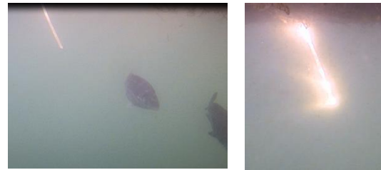
図 8 (左) . ギョニゲールと忌避行動をとるクロダイ