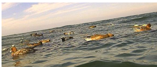
図 7. セット内で摂食するカモ類