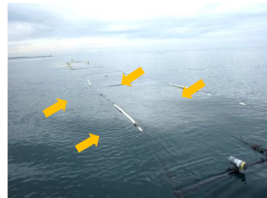
図3. カバー（矢印）を取り付けたセット