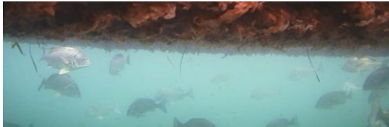
図 6. 養殖網の下に蝟集するクロダイ