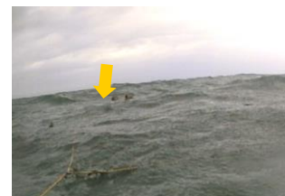
図4. 荒天でもカモ類（矢印）が出現

岸寄りのセットではカモ類がノリを摂食の様子が確認された。最大風速8m/sを超える悪天候時にもカモが40分以上セット内に滞在していた（図4）。なお、波浪の影響でカメラの向きが変わったこと等により水中画像は得られなかった。沖側のセットでは、カモが出現したのは5分のみだったのに対し、クロダイはカメラ設置後4日後から出現し、2日間にわたって合計570回の摂食がみられ（図5）、約4cm 2 の視野に最大18尾のクロダイの蟇集が確認された（図6）。クロダイ以外の植食性魚類は確認されなかった。画像解析結果およびノリ葉体の食害痕から、当地区の食害種は岸寄り漁場ではカモ、沖側漁場ではクロダイであると考えられた。