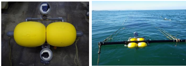
図1. カメラ架台にとりつけたタイムラプスカメラ（左）とセットへの設置方法（右）

明和町大淀地区、伊勢市今一色地区の浮き流し養殖漁場において、2022年11月から12月にかけてノリ養殖施設（以下、セットという。1セットはノリ網4枚からなる）にタイムラプスカメラ（Brinno社製 TLC200Pro）を設置し、撮影された静止画から食害種やその出現頻度を確認した。タイムラプスカメラは防水ハウジングに入れてフロート付きのカメラ架台に上下1台ずつ固定し、大淀地区では岸寄りのセットと沖側のセットに、今一色地区では岸寄りのセットに設置して、6:00から18:00まで5秒間隔で撮影した（図1）。