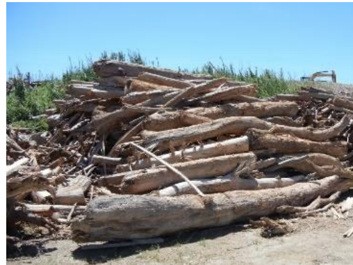
大雨後に港で回収された流木

流域圏での海洋ごみ対策の推進により、伊勢湾の良好な景観や海洋環境の保全を図ることを目的に、岐阜県・愛知県・三重県が共同で本計画を策定