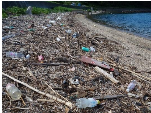
海岸に漂着したプラスチックごみ