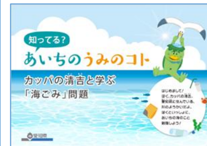
愛知県 環境学習プログラム