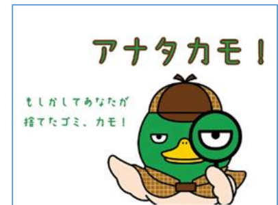
三重県 普及啓発動画