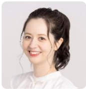
春香クリスティーンさん