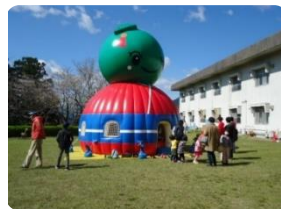
新姫ちゃんエアトランポリン