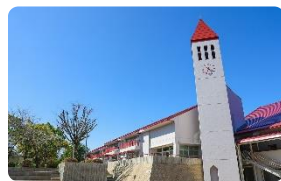
スズカト (鈴鹿青少年センター)