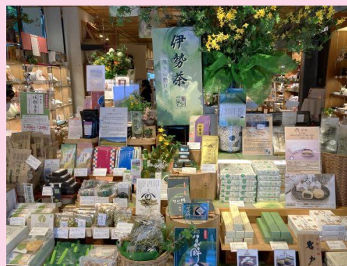
伊勢茶ショップディスプレイ(5月) インスタライブの様子