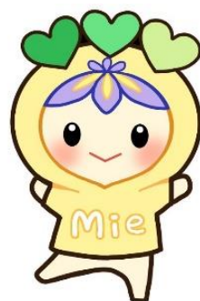
三重県人権センターマスコットキャラクター

子どもも、おとなも、好きな「絵の本」に出逢えることを願って、この度、三重県人権センターにおいて「絵の本ひろば」を開催します。よい出逢いがありますように！