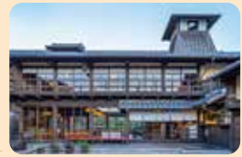
五十鈴川など伊勢の自然を感じられる会場です。

おかげ横丁を管理、運営し地域の歴史や文化を守りながら、現代の観光産業を発展させてきた企業（株式会社伊勢福）の経営者から、経営戦略や地域資源を活かした事業展開について話を伺います。