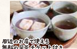
周辺のお店で使える 無料の呈茶チケット付き