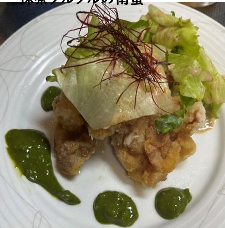
白子高等学校 「たるるん茶ん」 抹茶タルタルの南蛮