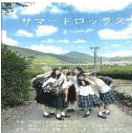
松阪商業高等学校 「地域アンバサダー 花咲かビーズ 松阪茶ビーズ」 伊勢茶プロモーション動画