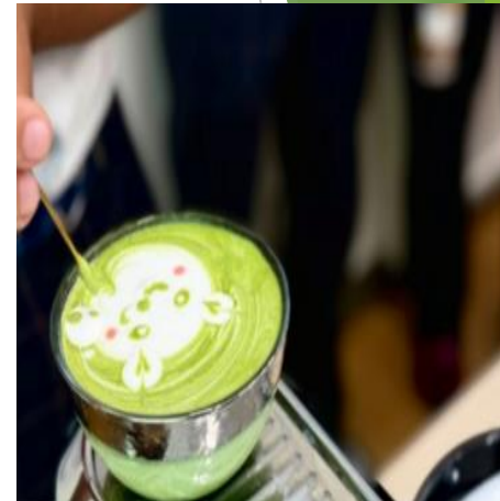
飯南高等学校 「飯南高校美術部」 伊勢茶ラテアート体験教室