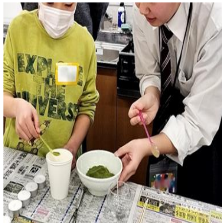
神戸高等学校 「神戸高校放送部」 神戸高校のみんなと急須でお茶入れ体験