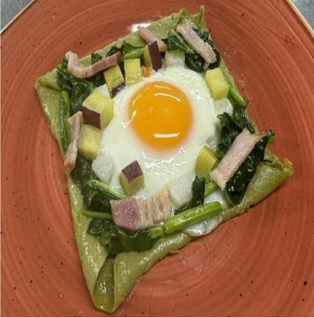
相可高等学校 「おおきんな」 伊勢茶香る伊勢芋ガレット