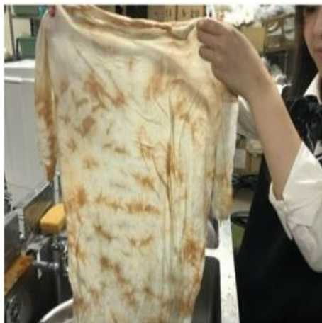
青山高等学校 「青山高校フラワーデザインサークル」 伊勢茶染めの衣料展示会