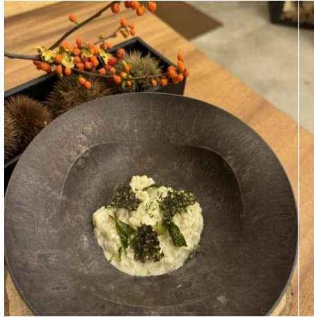
飯南高等学校 「飯南茶っ子」 伊勢茶のリオレ