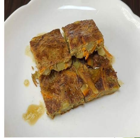
白子高等学校 「お茶クラブ」 ほくほくお茶チヂミ