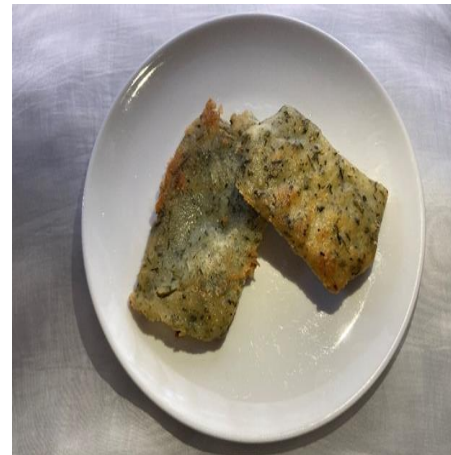
白子高等学校 「SR31」 チーズの伊勢茶巻き