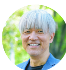
株式会社ジオコス 代表取締役