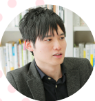
リクルートワークス研究所 主任研究員