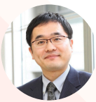
名古屋産業大学 准教授