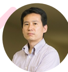
神奈川大学 経営学部 特任准教授

インターンシップ研究の第一人者。「企業のためのインターンシップ実施マニュアル」著者。