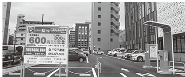
▲三交の駐ing四日市鶴の森(三交不動産株式会社)