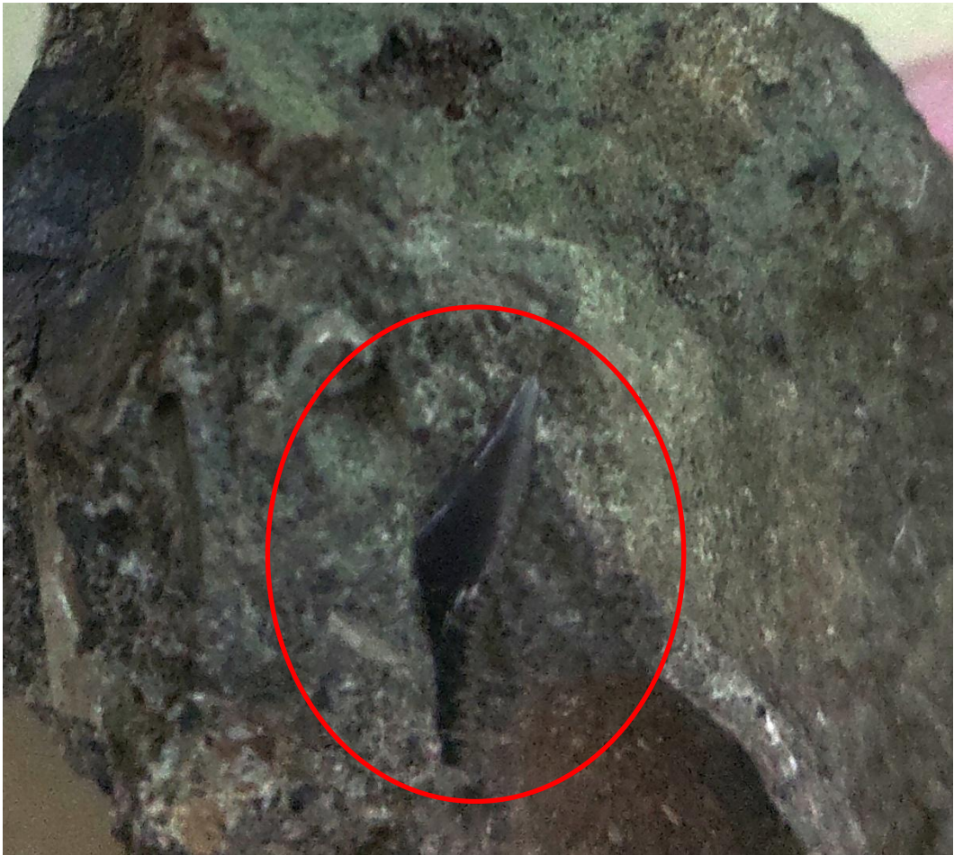
巻貝の化石（参加者から）