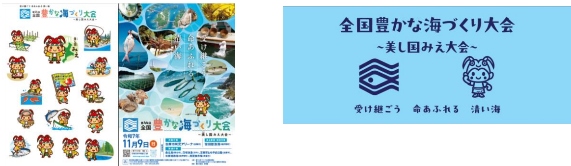
大会PRグッズ（イメージ）

(1) PRグッズの作成や、招待者に三重県ならではの大会記念品を提供するため、予算を追加し、内容を充実させます。