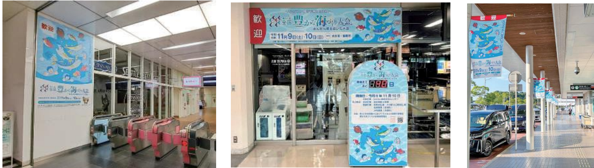
各種広告・会場周辺施設装飾(イメージ)

多くの県民の方や観光客の方に大会を知っていただくことにより大会の気運醸成を図るため、会場周辺を中心に各種広告や装飾を行い大会のPRを行います。