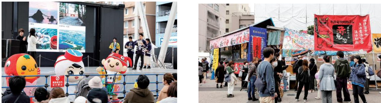
関連行事の内容の充実(イメージ)