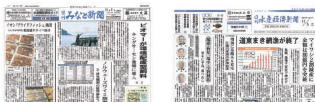
大会記念新聞(イメージ)