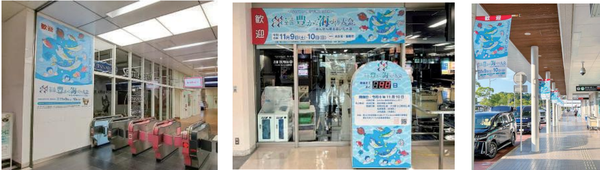
各種広告・会場周辺施設装飾(イメージ)

多くの県民の方や観光客の方に大会を知っていただくことにより大会の気運醸成を図るため、会場周辺を中心に各種広告や装飾を行い大会のPRを行います。