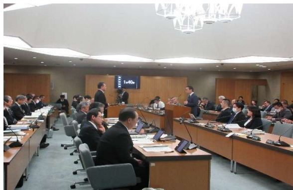
図5-1 総括質疑（令和8年3月9日）

総括質疑の方法は、午前2時間、午後2時間の合計4時間について各会派に質疑時間を配分し、発言通告制を用い、知事の出席を求めて対面演壇方式で行っていましたが、平成18年10月からは発言通告制を廃止して行っています。