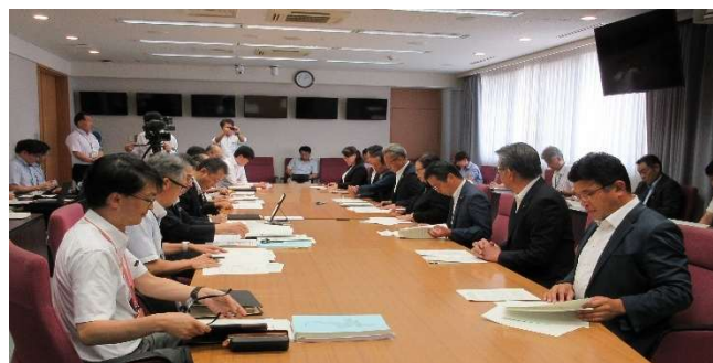
図5-2 知事への申入れ（令和7年8月8日）

これらの調査結果に基づき、「県政レポートに基づく今後の県政運営等に関する申入書」を作成し、予算決算常任委員会正副委員長と各行政部門別常任委員長の連名で、8月上旬 40 頃に知事に対して申入れを行います。