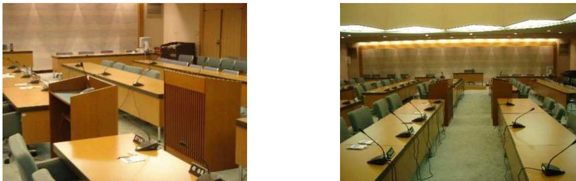
図 5-3 対面演壇の配置