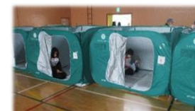
避難所用 間仕切りテント