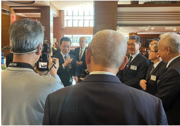
（高雄静思堂の玄関ホールで多くの方に歓迎され、挨拶する一見知事）