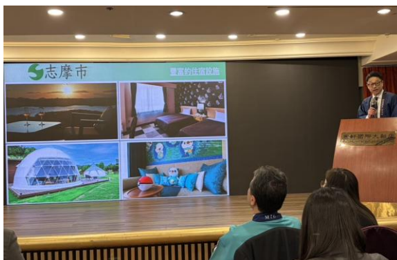
(志摩市長のプレゼンの様子)