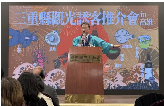
(挨拶する一見知事)