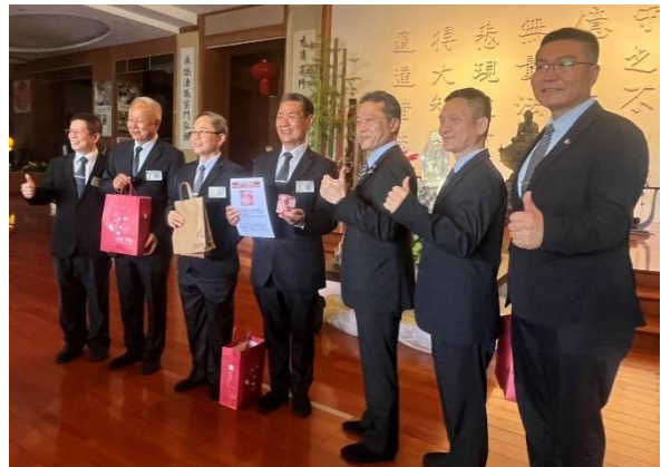
（記念品を交換した後の記念撮影）