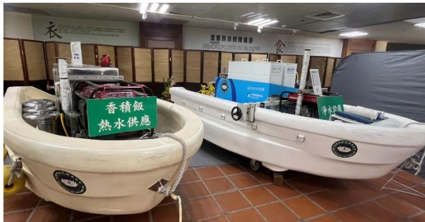
（被災地へ運んで使う浄水装置（右側））