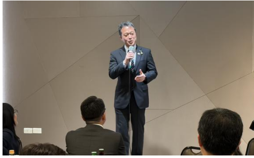
(挨拶する一見知事)