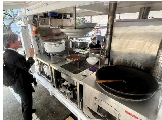
（移動式のキッチンセット。3.5 tトラックで移送し、現地で高さを調節して設営する。）