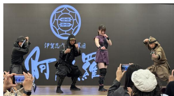
(伊賀忍者特殊軍団「阿修羅」の実演)