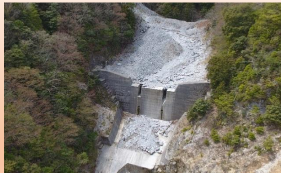
流れてきたたくさんの土砂をとめています