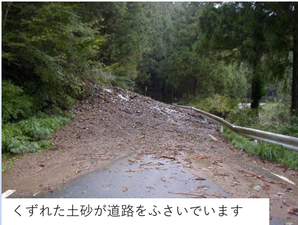
くずれた土砂が道路をふさいでいます