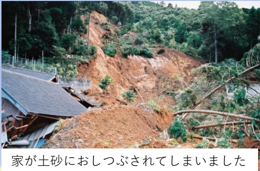
家が土砂におしつぶされてしまいました