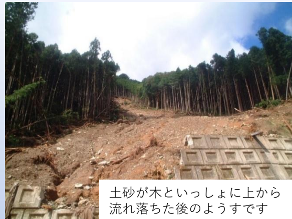
土砂が木といっしょに上から流れ落ちた後のようすです