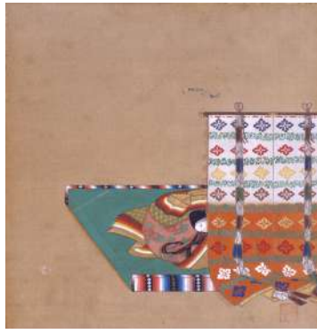
上段左から 源氏物語図色紙 賢木（堺市博物館蔵） 伊勢物語手鑑 狩の使（名古屋博物館蔵） 春秋草花図下絵三十六歌仙図色紙貼交屏風より 齋宮女御〔部分〕（齋宮歴史博物館蔵）