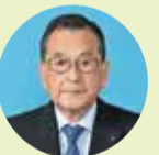
やまもと のりかず 山本 教和 自由民主党 志摩市