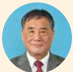
のぐち まさひろ 野口 正 自由民主党 松阪市