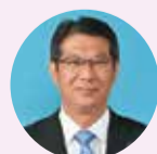
やまうち まさよし 山内 道明 公明党 四日市市