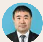
むらやま りつすん 村林 聡 自由民主党 度会郡