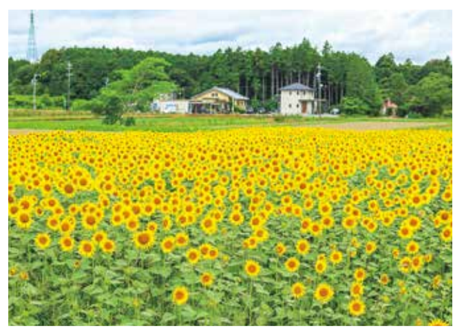
アスピア玉城 ひまわり畑（玉城町）