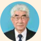
にしば のぶゆき 西場 信行 自由民主党 多気郡