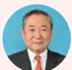
ひがし とよ 東 豊 自由民主党 東紀州