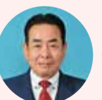
なかもり ひろみ 中森 博文 自由民主党 名張市