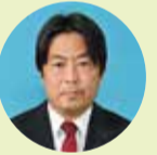
くらもと たかひろ 倉本 崇弘 自由民主党 桑名市・桑名郡