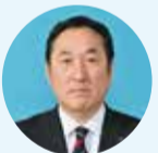
なかじま としき 中嶋 年規 自由民主党 志摩市